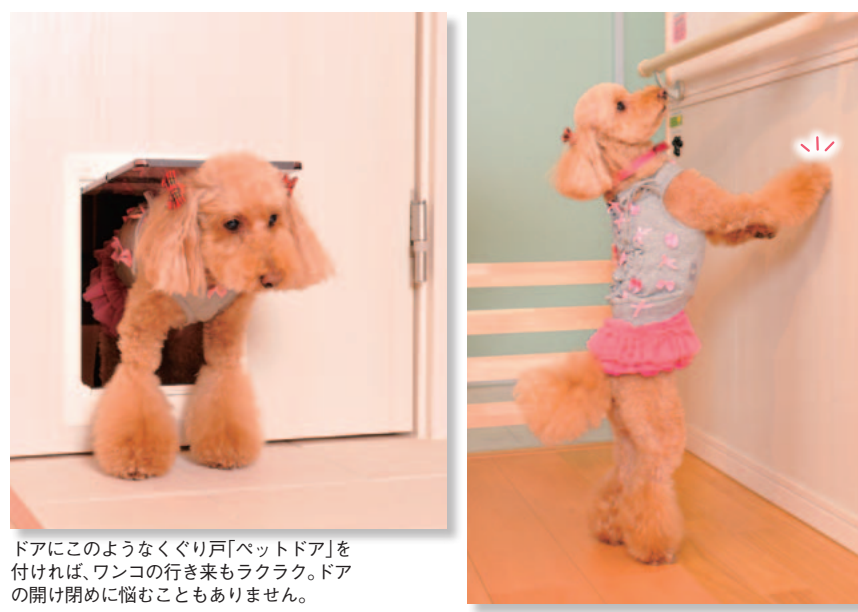
ドアにこのようなくぐり戸「ペットドア」を付けば、ワンコの行き来もラクラク。ドアの開け閉めに悩むこともありません。

床についてはよくわかったけど、そのほかにもワンコと暮らす上での工夫にはどんなものがあるのかしら？ 腰壁を付けると、壁の汚れや傷などを防ぐことができます。ワンコが部屋を自由に行き来できるペットドアも、付けておくと便利です！